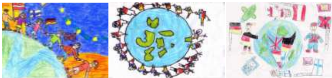
Bilder in der Reihenfolge: Eitorf - Caddington- Lark Rise – Hämeenlinna - Harmonie