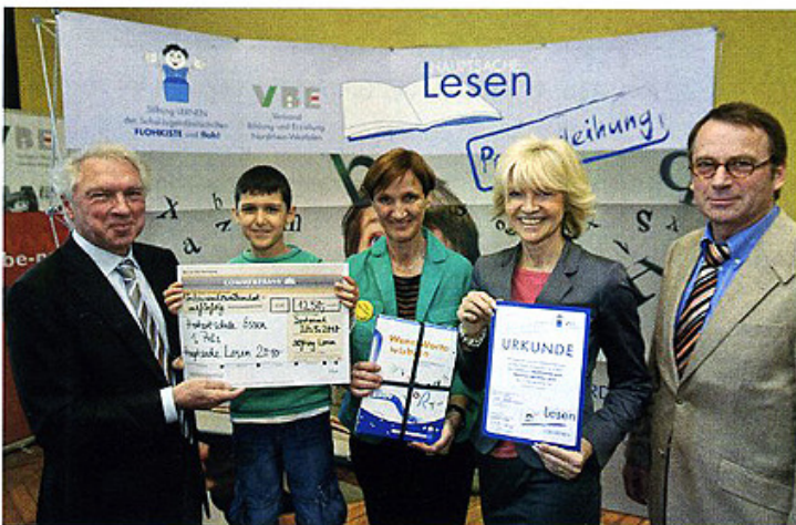
1. Preis : Herbart-Grundschule in Essen

Lesen wird in der Grundschule Kuhstraße großgeschrieben und durch vielfältige Projekte werden die Schülerinnen und Schüler auf diesem Weg unterstützt.