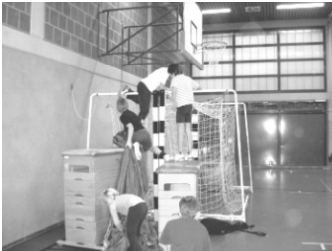
„Die Kinder der Grundschule Harmonie bauen eine Drachenhöhle“

Das Konzept der Bewegungsbaustelle setzt den Werkstattgedanken in der praktischen Arbeit mit Kindern an, es geht hier um ein Werkstatt-Lernen. Mehr als die Psychomotorik möchte die Bewegungsbaustelle die Kinder in ein Tun durch Bewegung und Körpererfahrung verwickeln: Kinder konstruieren und erfinden Bewegungsspiele und -übungen wie in einer Erfindungswerkstatt. So werden sie angeregt, sich vielfältig in sehr unterschiedlichen Bewegungssituationen zu erproben.